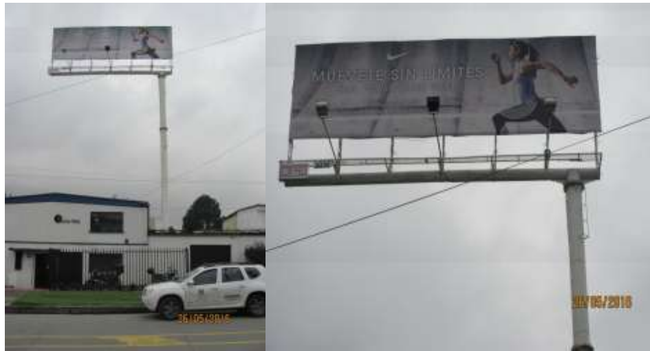
VALLA INSTALADA ANUNCIA SENTIDO NORTE - SUR: MUÉVETE SIN LÍMITES NIKE